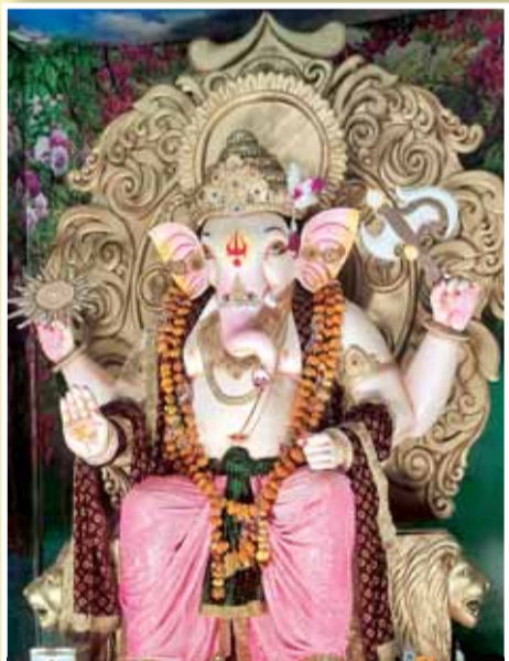
हरदौल मंदिर समिति सिहोरा