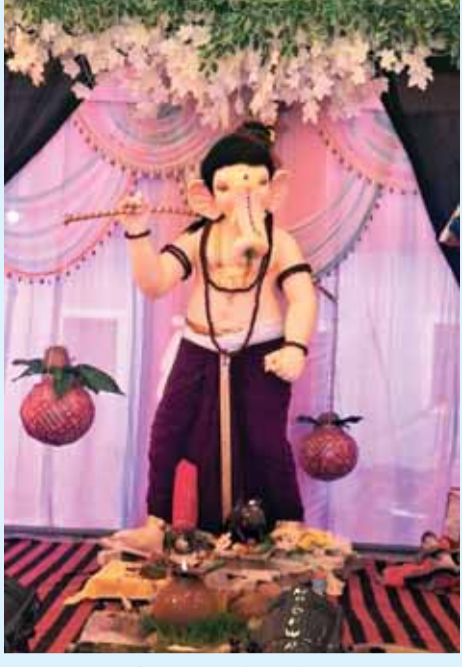
नया मोहल्ला रिछई में विराजे गजानंद