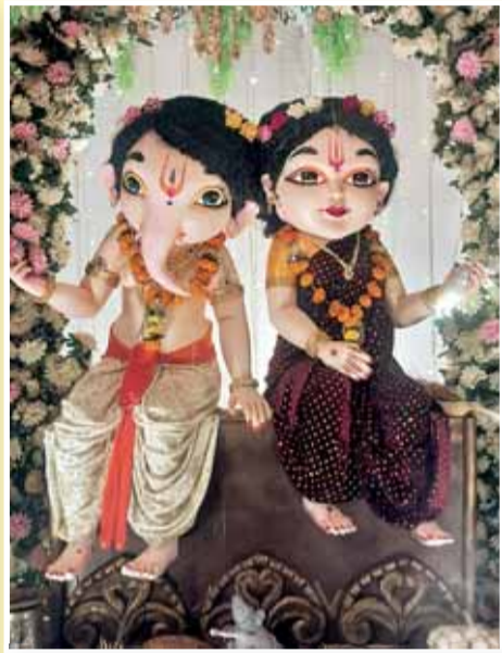
गौरैया मोहल्ला सिहोरा