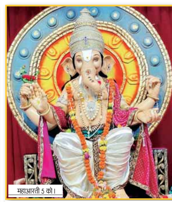
महाआरती 5 को।