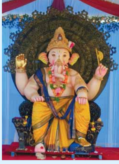
सिद्धि विनायक गणेश उत्सव समिति बाजार मोहल्ला बरेला