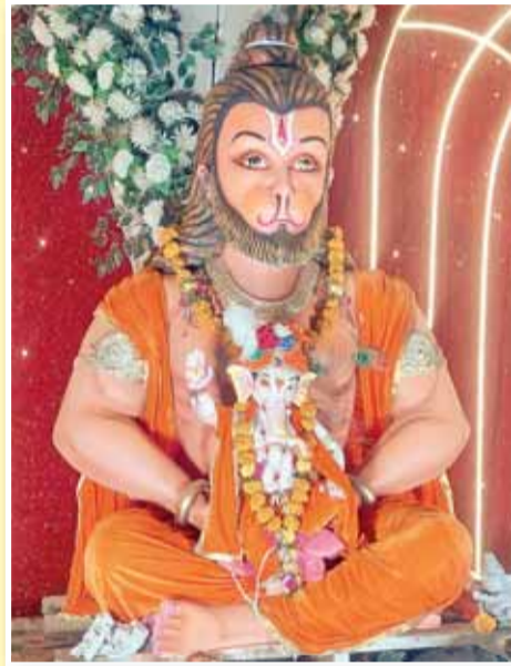
सिविल कोर्ट के सामने सिहोरा