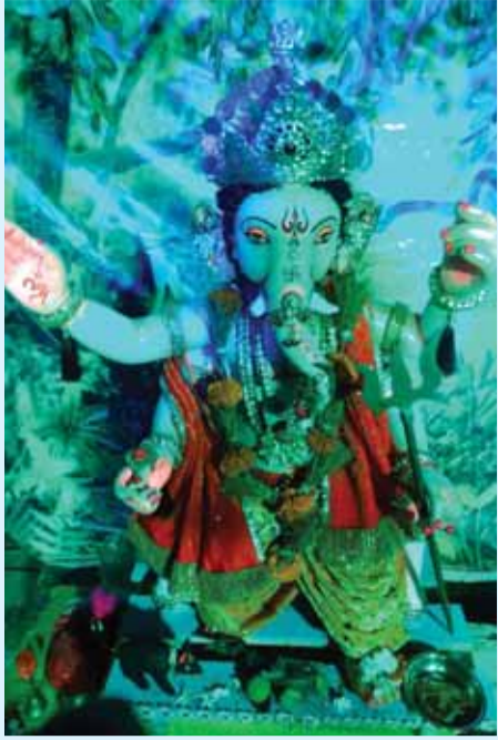
गोहलपुर मालगुजार परिसर नर्मदा नगर