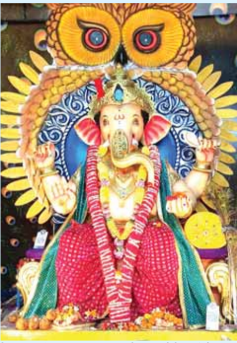
श्री आदर्श गणेश उत्सव समिति बावली लाइन पीपी कॉलोनी ग्वारीघाट