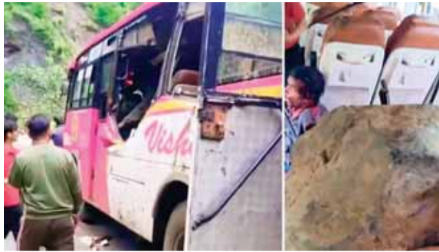
एचपी 63ए1891 नंबर की यह निजी बस एनएच 05 पर हादसे का शिकार हुई है। बिथल ट्रेवल नामक निजी बस पर कालीमिट्टी में बिथल के पास अचानक पहाड़ी से चट्टानें आ गिरीं। चालक को इसकी कोई भूक नहीं लग पाई। बस पर चट्टानें गिरने पर ही चालक को हादसे का पता चल पाया। वहीं, सुबह किन्नौर में भी पहाड़ी से दरकी चट्टानों को चपेट में छह से ज्यादा ट्रक आ गए। इस हादसे में छह सवारियां घायल हो गईं।

किन्नौर में दरकी चट्टानें, चपेट में आए ट्रक मंडी में भूस्खलन से अब तक 7 की मौत