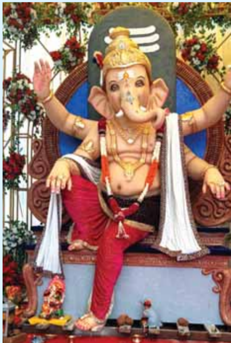
श्री सृजन गणेश उत्सव समिति पुरानी पी पी कॉलोनी ग्वारीघाट