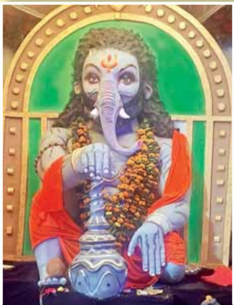
गड़बड़ समिति अनाज गोदाम के पास सिहोरा