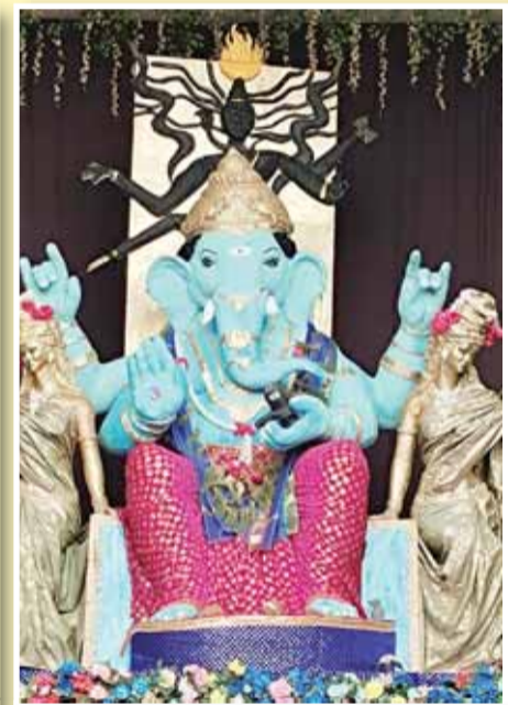
बस स्टैंड गणेश उत्सव समिति मझौली।