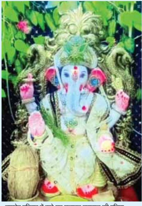
नामदेव परिवार में रखे गए गजानन महाराज की प्रतिमा पुरानी पीपी कॉलोनी ग्वारीघाट रोड।