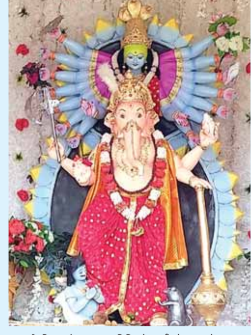
सार्वजनिक गणेश उत्सव समिति कोतवाली मोहल्ला बरेला