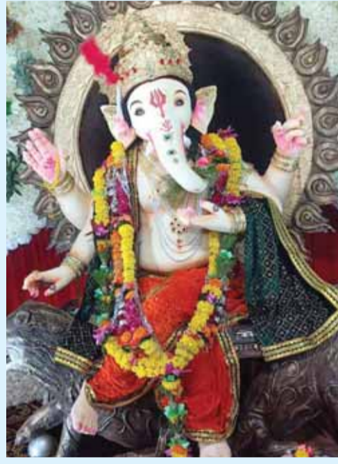
सरस्वती गणेशोत्सव समिति ने सरस्वती कॉलोनी चेरीताल वार्ड में स्थापित की प्रतिमा