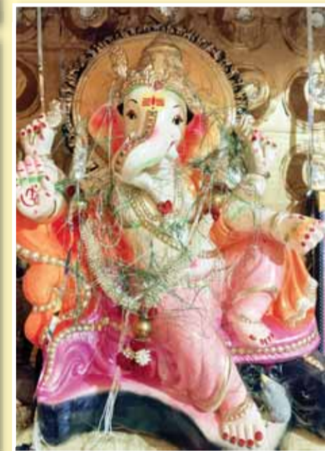
बाल गणेश उत्सव समिति कोस्टा मोहल्ला मझौली।