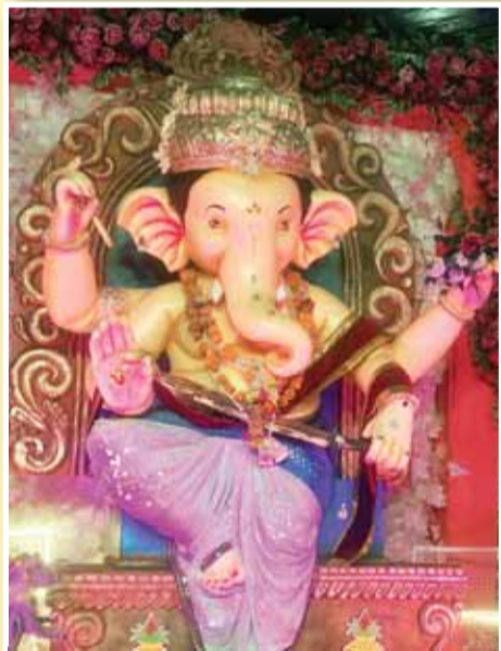
कटरा मोहल्ला सिहोरा