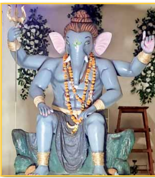
जय मानस गढ़िया मोहल्ला