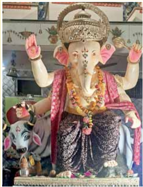
जय ज्योति आजाद चौक सिहोरा