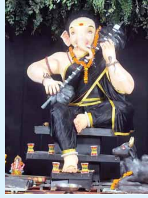
आंध्र गणेश उत्सव समिति चंडाल भाटा दमोह रोड स्थित दसवां वर्ष का प्रवेश इस वर्ष विशाल प्रतिमा स्थापित।