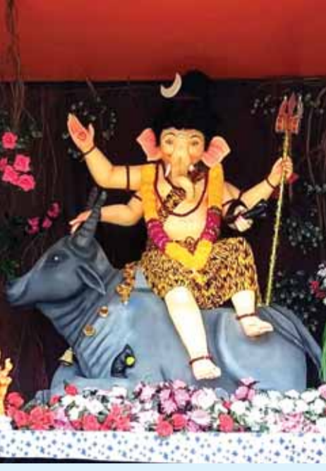
गणेश उत्सव समिति बरेला रामलीला रंगमंच